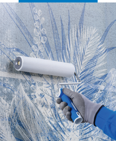
Auftragen von Mapecoat Decor Protection auf dekorativer Glasfasertapete