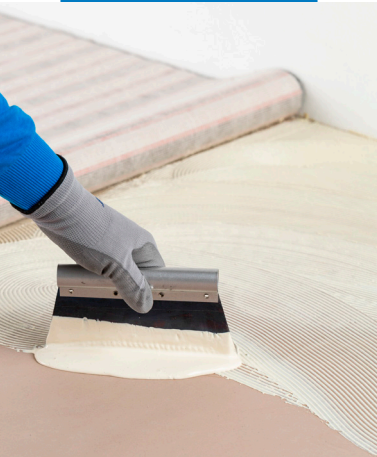
Auftrag von Ultrabond Eco TX2