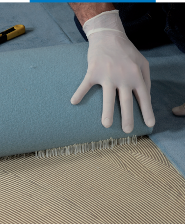
Verlegung von Nadelvlies